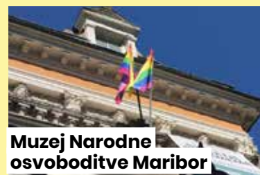
Muzej Narodne osvoboditve Maribor