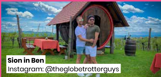
Sion in Ben

»To je moj drugi zaporedni obisk slovenskega Pink Weeka in vsako leto sem presenečen nad tem, kako so vsi prijateljski in kako dobrodošlega se počutim. Sem LGBT oseba, ki veliko potuje s svojim fantom, in kraji, kot je Slovenija, ki so tako sprejemajoči do istospolnih parov, me navdajajo z optimizmom. Lahko smo to, kar smo, in svobodno izkazujemo svojo ljubezen v čudoviti Sloveniji.«